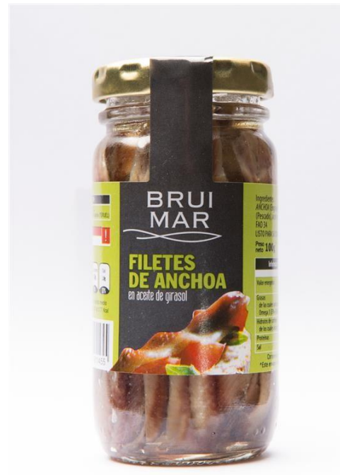
MF1004 FILETE ANCHOA TARRO CRISTAL