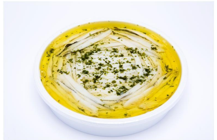
MF3001 BOQUERÓN AJO, PEREJIL Y ACEITE DE OLIVA