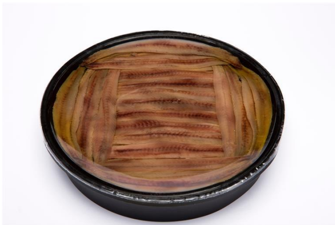
MF1002 FILETE ANCHOA CANTÁBRICO "0"